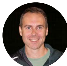
Infrastructuur en externe relaties Steven Sack